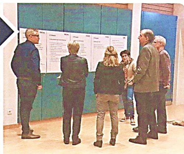
Angeregte Diskussion in der Gruppe